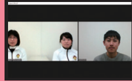
実際のパソコンの画面 (Zoom 使用)