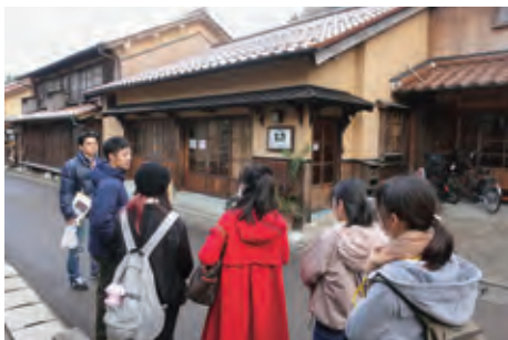
大森町のまち歩き