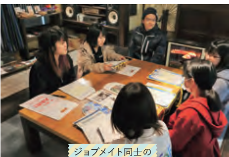
ジョブメイト同士の意見交換会