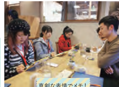
真剣な表情でメモ！

いろんな経験をした大人の方の話をたくさん聞いた事が、何よりも大きな収穫でした。このツアーに参加したからこそできたこと、気づけた事が多かったので、とっもためになる内容だったと思います。