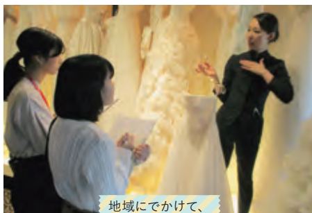
地域にでかけて、積極的に取材！