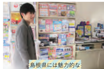
島根県には魅力的な 企業がいっぱい！

「あの企業のことが知りたい」「この業種の仕事って、具体的にはどんなことをするんだろう？」そうした声をください！その声をもとに企業を訪問し、取材をしましょう。自分たちで取材した内容は「TOBIRA」などで発信！