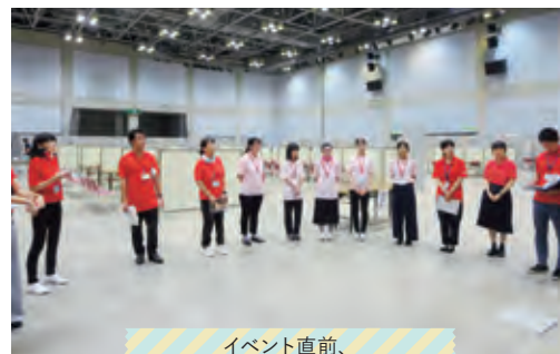
イベント直前、 ジョブカフェスタッフと打ち合わせ