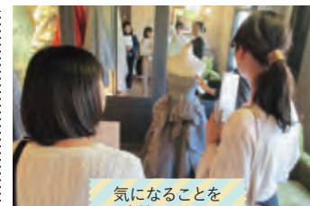
気になることを 直接聞こう！