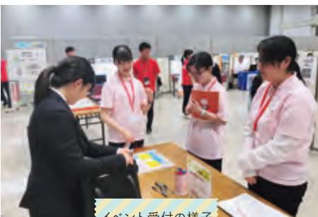
イベント受付の様子