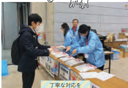
丁寧な対応を心がけます！