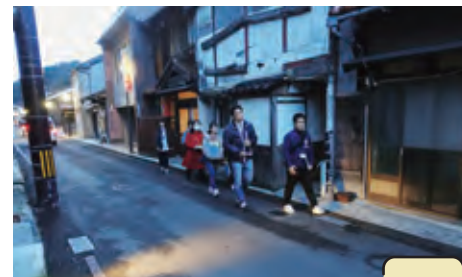
温泉津のまち歩き